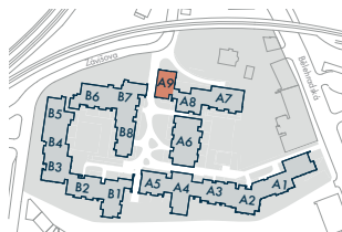
SEKCE A9 • SECTION A9