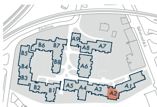
SEKCE A2 • SECTION A2