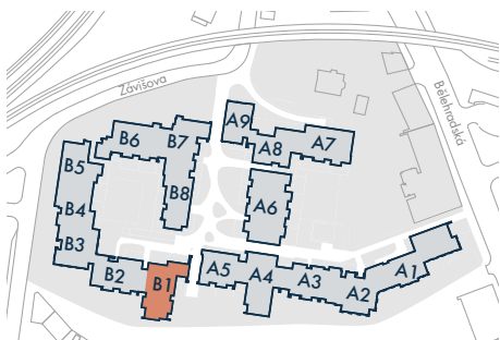
SEKCE B1 • SECTION B1